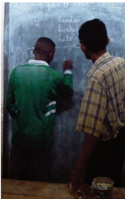
Campagne d'alphabétisation dans la prison de Farafangana